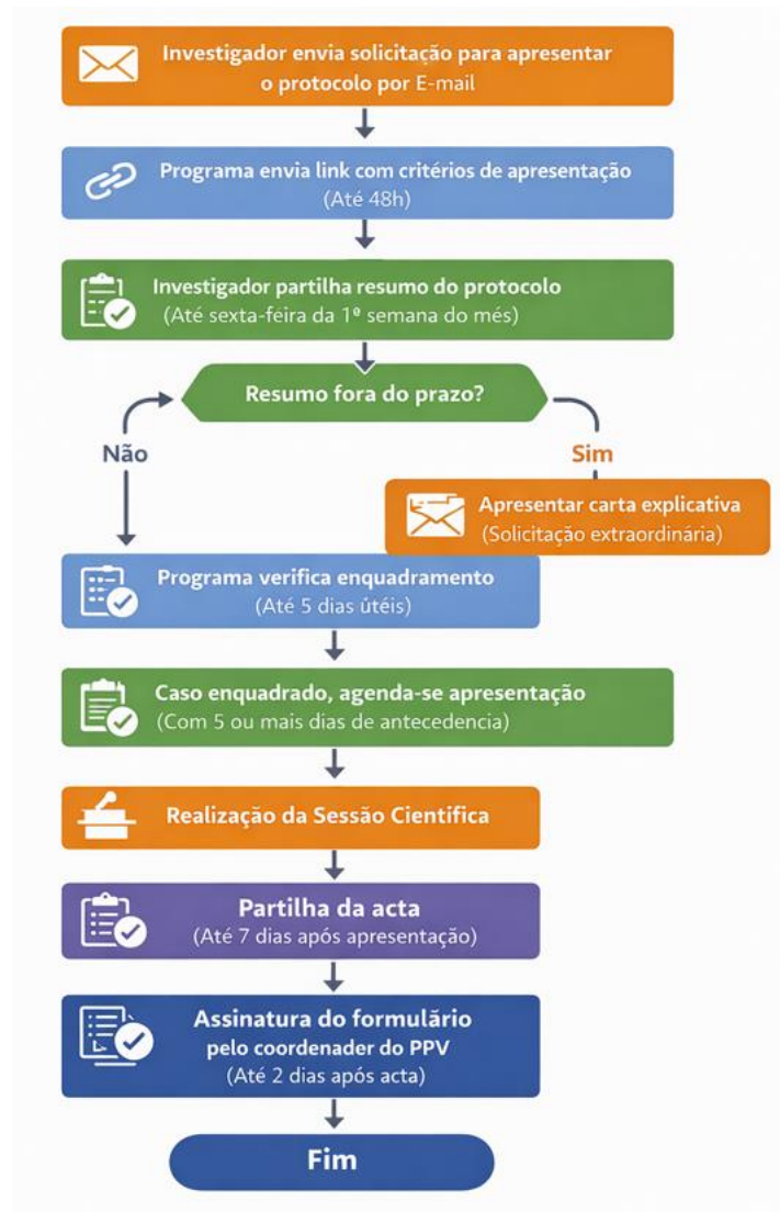
Figura 1: Fluxograma para Apresentação e Discussão de Protocolos no PPV